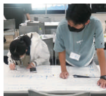
グループの考えをまとめて発表します