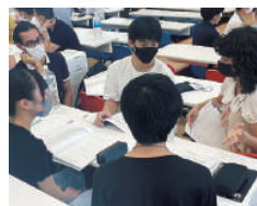
ディスカッションで考えを深める

「Global English Camp」では、海外学生コーチのリードのもと、グループのメンバーが英語でディスカッションを行い、まとめた意見を資料にまとめます。まさに、大学入学共通テストの特徴である「探究型」問題の実践の場です。